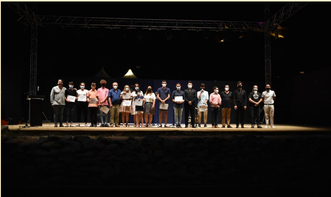
30 de julio de 2021 en el Parque Barranc de la Font entrega de diplomas a los premiados del I Concurso Internacional de Trompeta "José María Ortí Soriano".