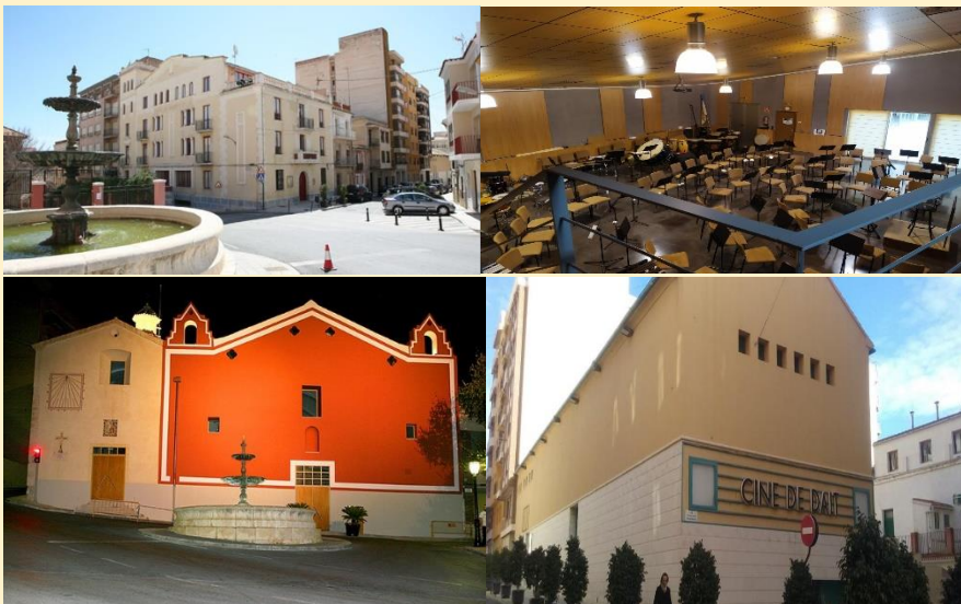
Sedes del Festival Internacional de Trompeta Ciutat de Xixona.

Dentro de los espacios distinguiremos los destinados a estudios, marcados con un identificador “E” (lugar dedicado a que los participantes en el curso puedan estudiar y preparar las obras musicales que trabajarán durante el curso y donde se impartirán las clases del mismo). Identificador “C” (lugar dedicado a la realización de los conciertos) Identificador “G” (lugares destinados a la manutención de profesores y alumnos.)