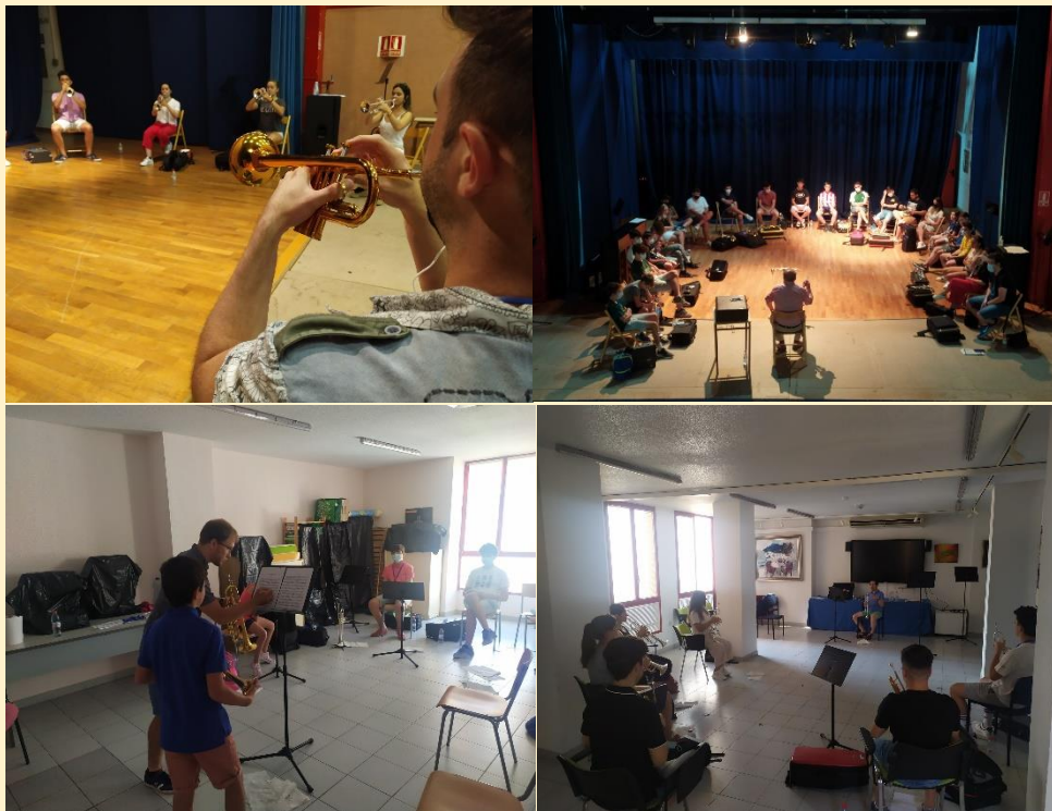
Clases de la tercera edición del "FIT XIXONA" julio de 2021.

La admisión no estará limitada por motivos de edad, pero la organización advierte que, fuera del horario establecido del curso, no se hará responsable de los menores de edad que pudieran inscribirse, dado que quedarían fuera de las actividades lectivas programadas.