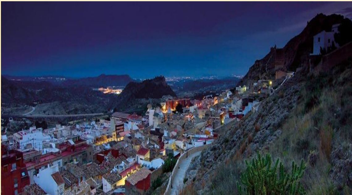
Vistas panorámicas de Xixona.

El FIT Xixona, partiendo de la experiencia positiva en la edición anterior, organizará una bolsa de viviendas en el municipio para alojamiento de los participantes que así lo deseen. Ese alojamiento NO incluirá ni comida ni cena, ya que se hará todos juntos, participantes y profesores en los restaurantes concertados. El desayuno de profesores y alumnos correrá a cargo de la organización todos los días del curso. La estimación de gasto para cada alumno en concepto de alojamiento y manutención será de 35 € diarios.