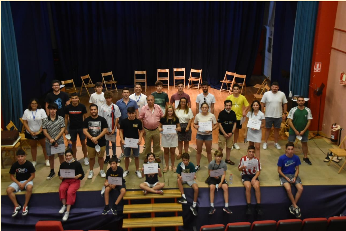
30 de julio de 2021 entrega de diplomas a los alumnos del "FIT XIXONA".