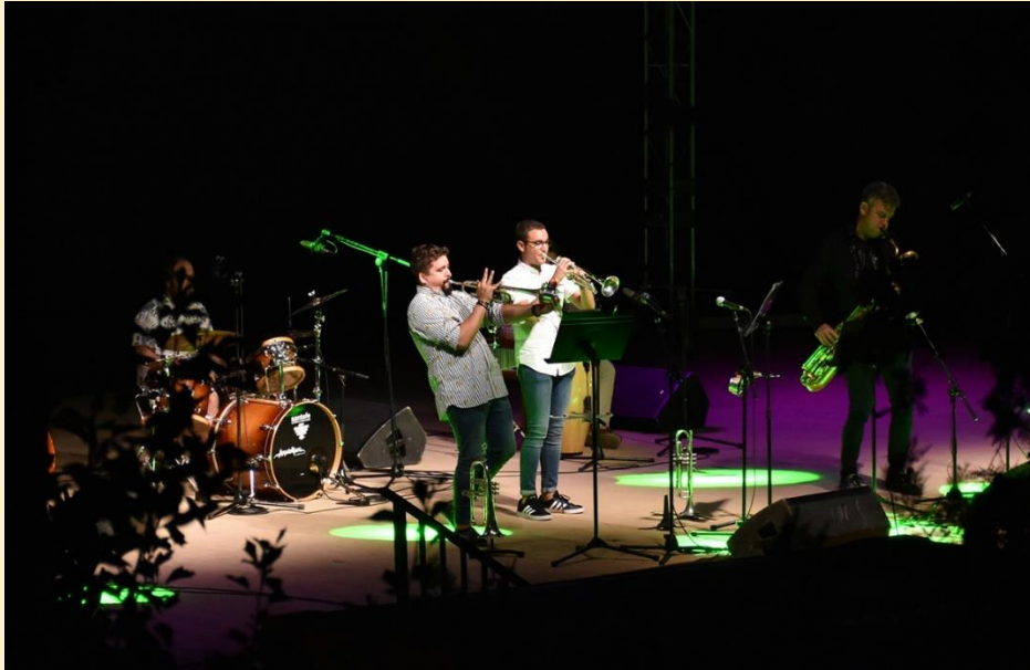
29 de julio de 2019 en el Parque Barranc de la Font concierto de Almaens Jazz Band.

FESTIVAL INTERNACIONAL DE TROMPETA CIUTAT DE XIXONA