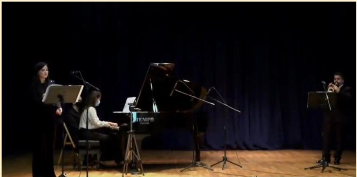
23 de diciembre de 2020 primer concierto del segundo "FIT XIXONA". "Si Suoni La Tromba".