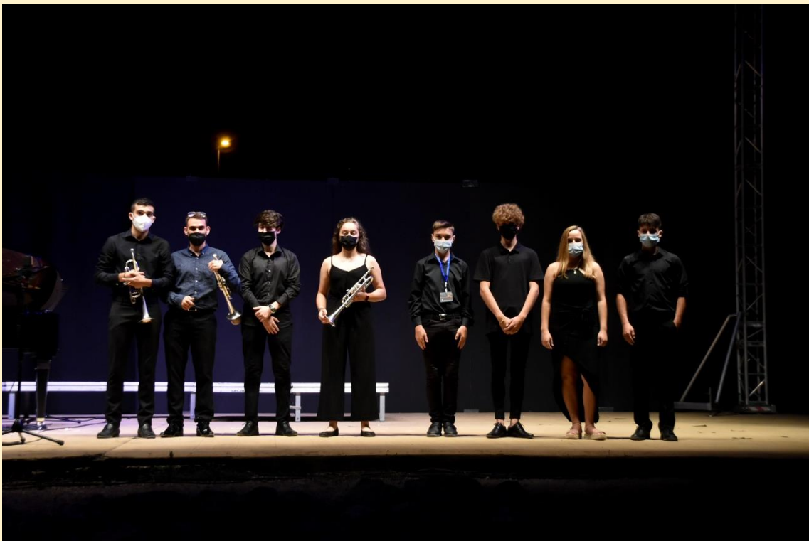
29 de julio de 2021 finalistas y ganadores del I Concurso Internacional de Trompeta “José María Ortí Soriano”.