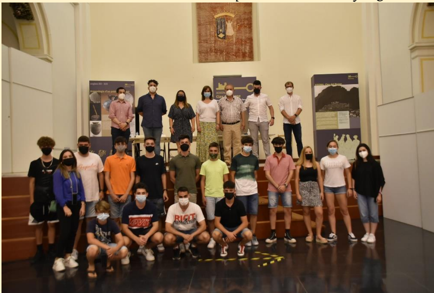
25 de julio de 2021 Recibimiento y presentación para profesores y alumnos del Festival en el “Teatret” de Xixona por las autoridades y organización.