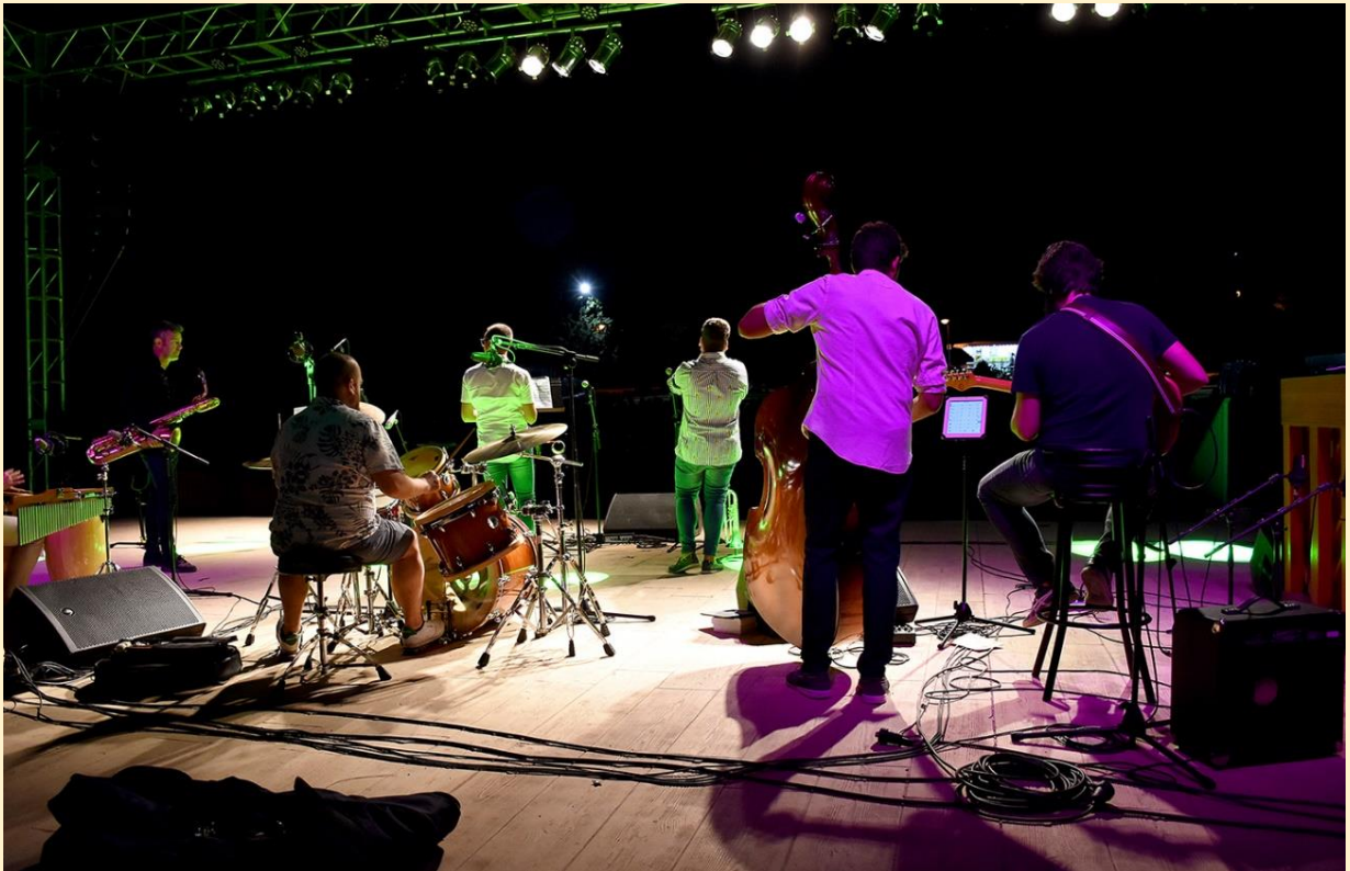
29 de julio de 2019 en el Parque Barranc de la Font concierto de Almaens Jazz Band.

FESTIVAL INTERNACIONAL DE TROMPETA CIUTAT DE XIXONA