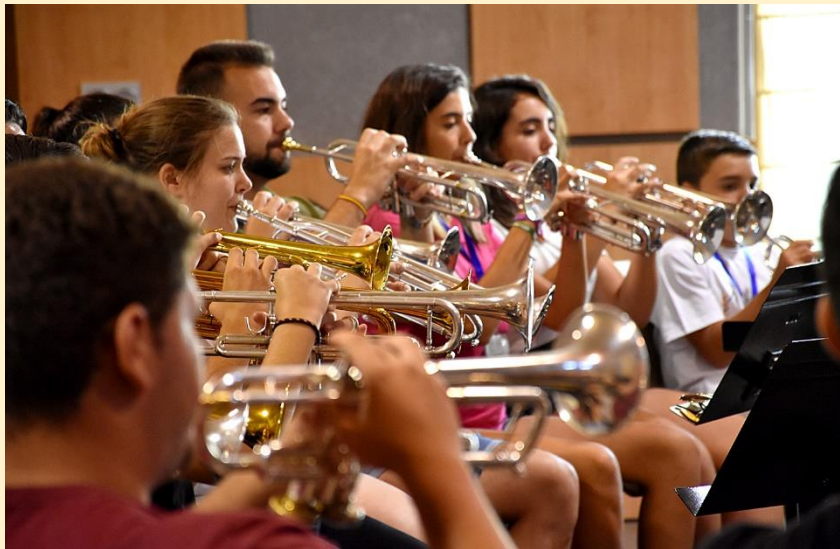
30 de julio de 2019 Alumnos del Festival en pleno calentamiento colectivo.