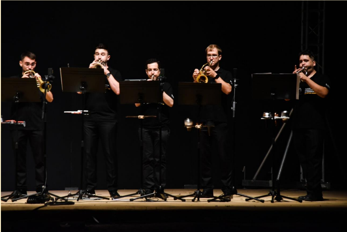
27 de julio de 2021 concierto de “NIT XIXONENCA” a cargo de los maestros del Festival y la Coral de Voces Blancas de Xixona.

FESTIVAL INTERNACIONAL DE TROMPETA CIUTAT DE XIXONA