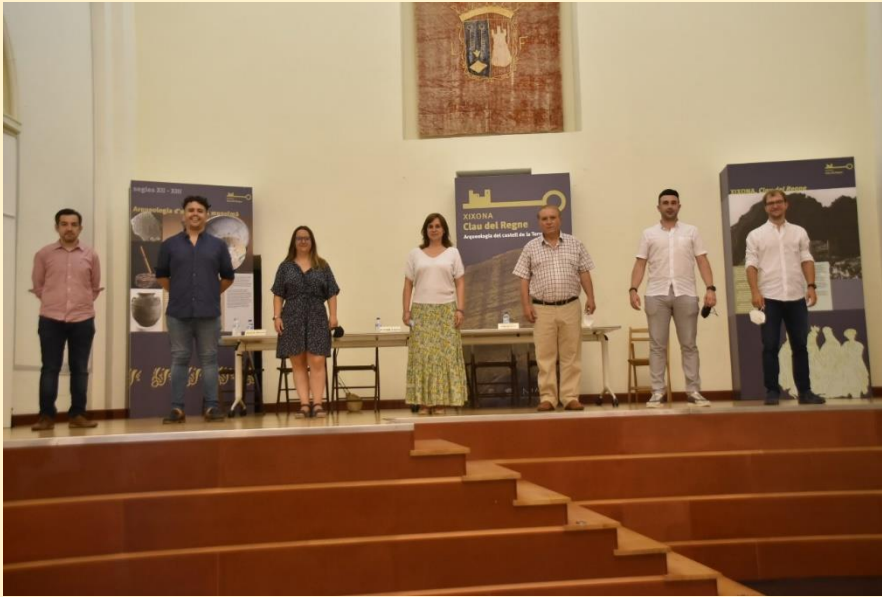
25 de julio de 2021 Recibimiento y presentación para profesores y alumnos del Festival en el “Teatret” de Xixona por las autoridades y organización.

El Ayuntamiento de Xixona es entidad colaboradora en la organización, así mismo, la Fundación “Ciudad de Requena” y la Universidad Alfonso X El Sabio.