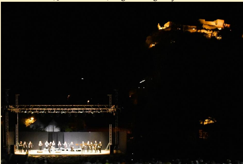
27 de julio de 2021 concierto de “NIT XIXONENCA” a cargo de los maestros del Festival y la Coral de Voces Blancas de Xixona.