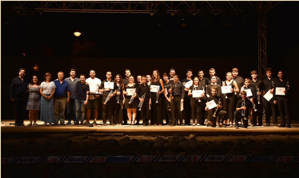
1 de agosto de 2019 en el Parque Barranc de la Font. Los alumnos, profesores y autoridades en la clausura del Festival.

FESTIVAL INTERNACIONAL DE TROMPETA CIUTAT DE XIXONA